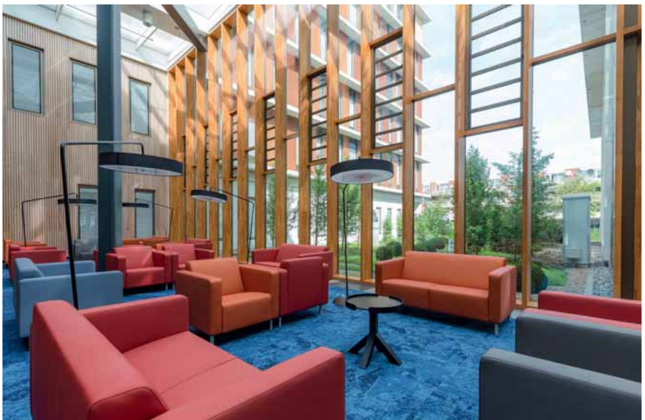
FOTO ONDER De hal doet met zijn comfortabele meubilair denken aan een hotelloobby.

FOTO BOVEN Linkerdeel van de hal, gezien vanaf de eerste verdieping.