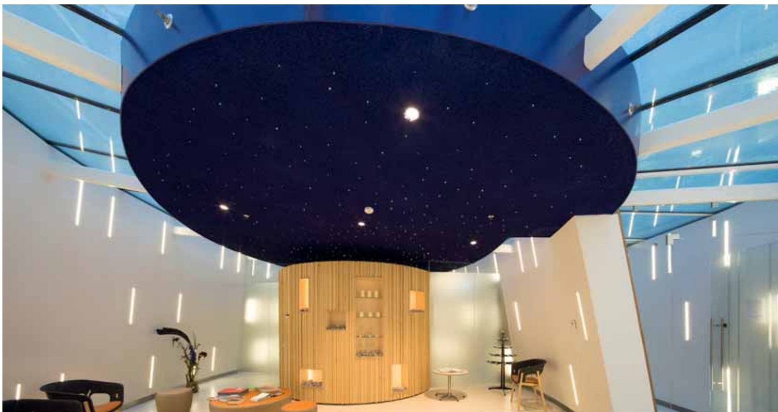
FOTO BOVEN De stilteruimte, met 'sterrenhemel' en 'wensmuur'.