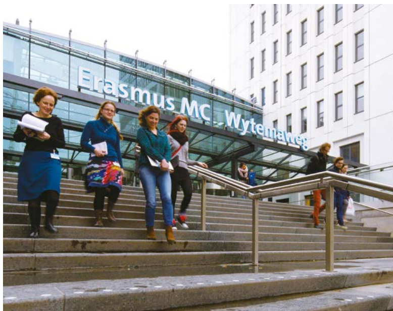
(Boven) Passage tussen parkeergarage en nieuwbouw. (Onder) Ingang Wytemaweg.