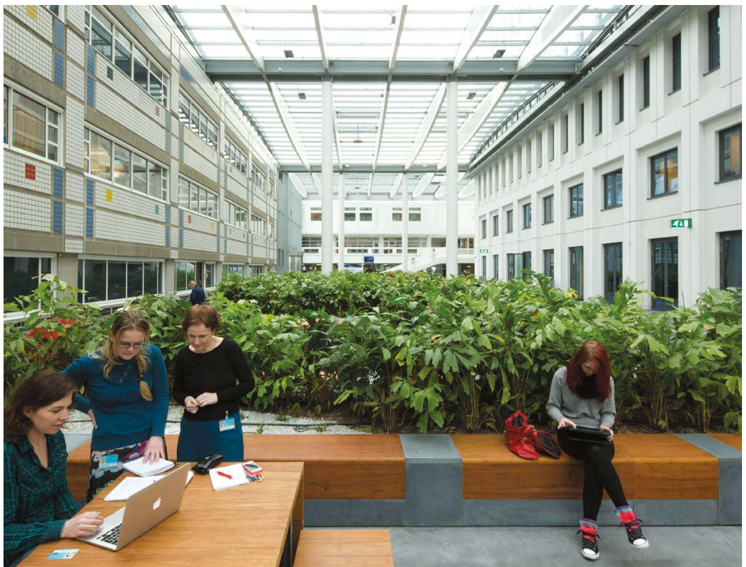
Personeel van het Erasmus MC en studenten van de universiteit maken dankbaar gebruik van de zitjes tussen het groen.