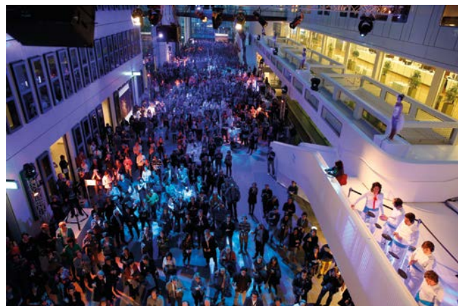
Veel ruimte voor diverse ontmoetingen.

In 2013 is het eerste deel van de nieuwbouw in gebruik genomen. In deze nieuwe gebouwdelen zijn de staffuncties, de apotheek, de laboratoria en de Centrale Sterilisatie Afdeling gehuisvest. Ook is de eerste polikliniek van de afdelingen fysiotherapie en Revalidatiegeneeskunde Rijndam naar de nieuwbouw verhuisd.