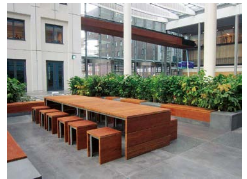
Lange houten tafel voor bezoekers of als vergaderplek.

Nieuw zijn ook de immens grote letters boven de diverse ingangen van het ziekenhuis die uitkomen op de Passage en het Plein. Ze geven de straatnaam aan waaraan ze grenzen, een onderdeel van het bewegwijzeringsplan van het ziekenhuis. De verschillende gebouwen van het Erasmus MC hebben een gebouwcode zoals Na, Nb en Nc. Straks helpen straatnamen in het publieksgebied om de zelforiëntatie van patiënten en bezoekers te bevorderen en stress te verminderen. Het past in het streven van het Erasmus MC naar een healing environment, waar patiënten gemakkelijk hun weg kunnen vinden zonder zich overgeleverd te voe-